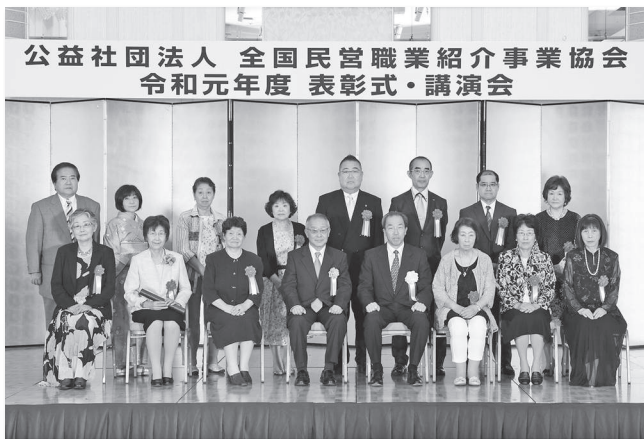
令和元年度 優良民営職業紹介事業求職者 厚生労働省職業安定局長表彰