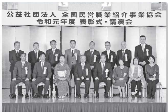
令和元年度 優良民営職業紹介事業求職者 公益社団法人 全国民営職業紹介事業協会会長表彰